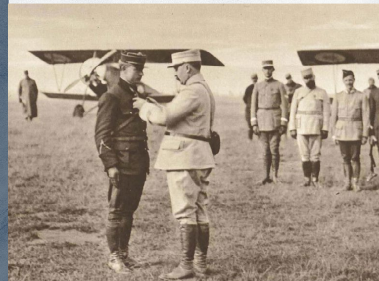
M. R. Štefánik ako pilot pri dekorovaní francúzskym vojnovým krížom

Priama súčinnosť Milana Rastislava Štefánika s česko-slovenským hnutím v zahraničí sa datuje od decembra 1915. Po operácii žalúdka v januári 1916 ho vymenovali za dôstojníka v službe Ministerstva zahraničných vecí Francúzska. Pre myšlienku rozbitia habsburskej monarchie a vzniku samostatného česko-slovenského štátu získaval novinárov, štátnikov a diplomatov vo Francúzsku (počas celého obdobia vojny), v Taliansku (1916), Rusku (1916 – 1917), Rumunsku (1916), USA (1917), opäť v Taliansku (1918) a napokon na Sibíri (1918 – 1919). Medzitým sa utvorila vláda ČSR, v ktorej sa Štefánik stal ministrom vojny. Jeho posledné diplomatické rokovania sa týkali urovnania kompetenčných sporov medzi francúzskou a talianskou vojenskou misiou v Československu v marci a apríli 1919. Štefánikova najťažšia misia bola na Sibíri, kde československé vojsko (asi 60 000 mužov), ktoré sa pôvodne usilovalo o transport do Francúzska, obsadilo Transsibírsku magistrálu a dostalo sa do občianskej vojny. Štefánikovou úlohou bolo povzniesť upadajúcu morálku vojakov, zorganizovať regulárne vojsko a na mieste rozhodnúť o jeho ďalších aktivitách.