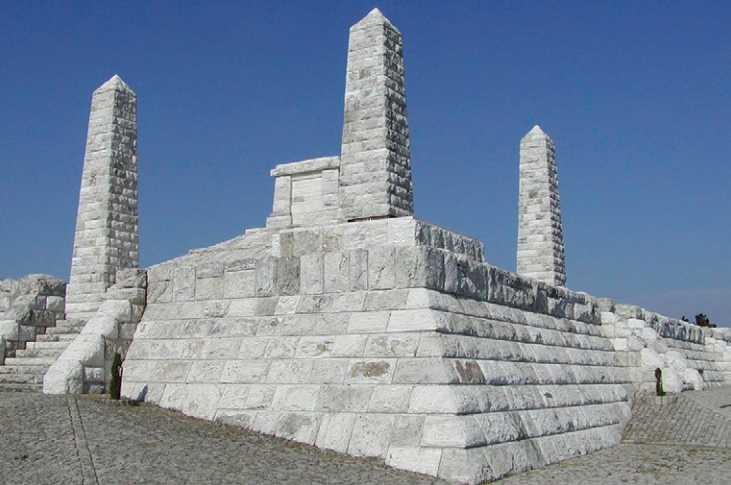
▲ Mohyla Milana Rastislava Štefánika, Bradlo

14. marca 1919 sa vrátil na mierovú konferenciu do Paríža rozhodnutý dosiahnuť, aby sa Ruská légia stiahla z frontu a urýchlil sa jej návrat do vlasti. Generál Štefánik zahynul 4. mája 1919 pri návrate do oslobodenej vlasti po páde dvojplôšnika typu Caproni Ca.33 neďaleko Ivanky pri Dunaji. Pochovali ho na Bradle, kde neskôr podľa návrhu architekta Dušana Samuela Jurkoviča vyrástla mohyla, ktorá sa stala pamätným miestom, symbolom odhodlania a boja za slobodu.